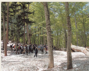
春のブナ林観察会

また、只見町のフィールドについてのお問い合わせに対応いたします。フィールドにお出かけの際は、お立ち寄りください。