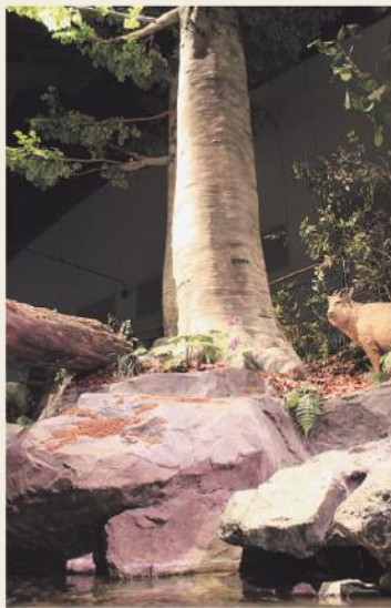
パノラマシアター

只見町のブナと自然をテーマにしたパノラマシアターです。ブナの巨木、鳥や植物、溪流などの自然を再現しています。また、只見町に生息する哺乳類や鳥類の剥製なども展示しています。