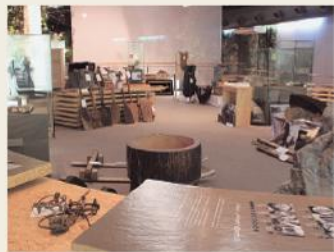
自然が育てた知恵

かつての只見川・伊南川流域に暮らした人々の川との密接なかかわりをジオラマと解説で再現しています。また、山樵道具、自然物採集道具、漁撈用具、狩猟用具など多数の民具を展示し、自然とともにくらす只見町の伝統文化を紹介しています。