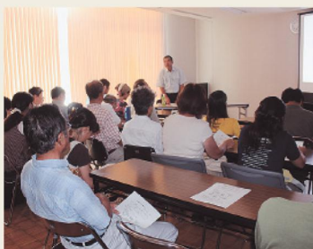
セミナー室での講演の様子

自然環境、生物、民俗などの専門家をお招きし、講演会ならびに各種講座を開催しています。また、只見町の歴史や伝統文化について町民のお話を聞く、座談会を行っています。