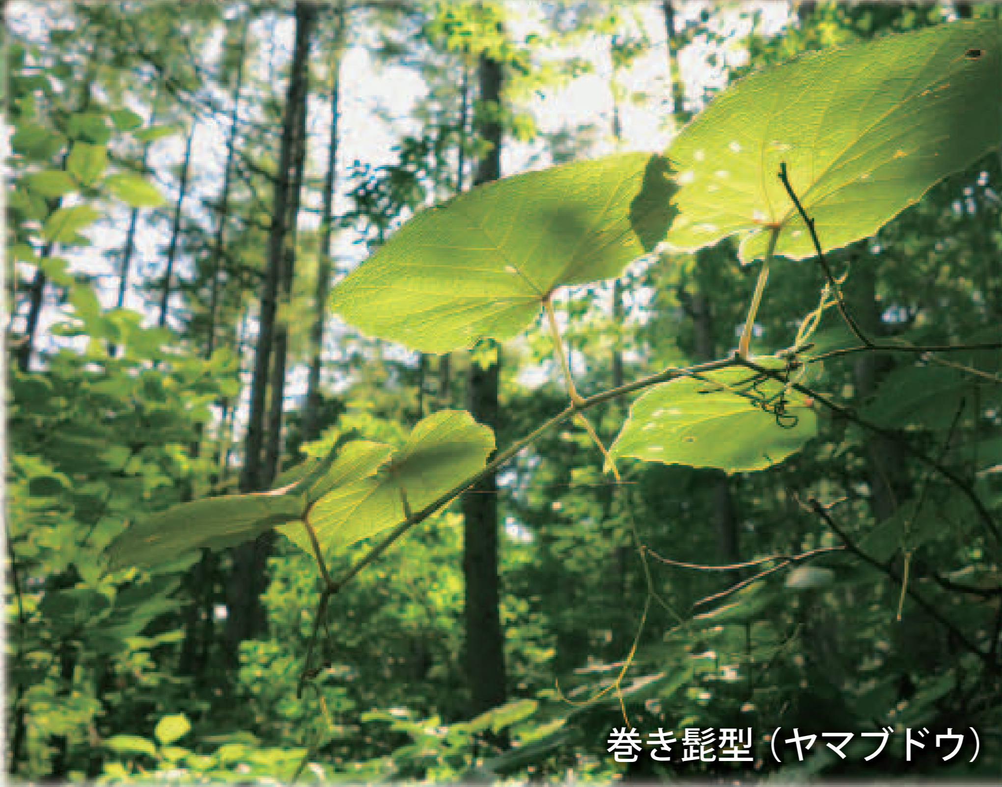
巻き髭型 (ヤマブドウ)