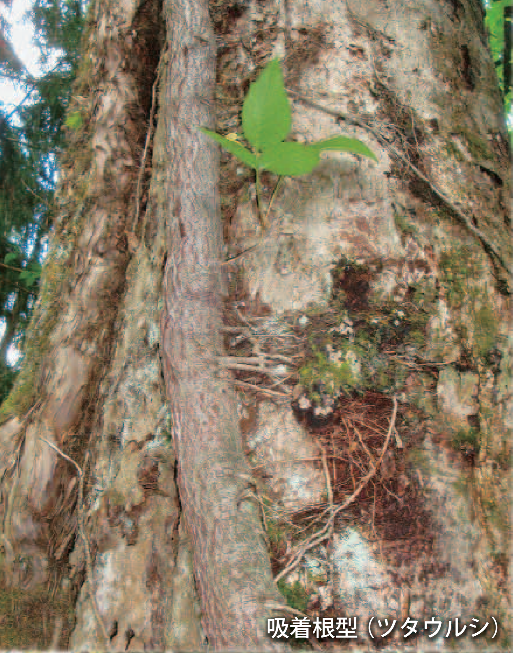
吸着根型 (ツタウルシ)