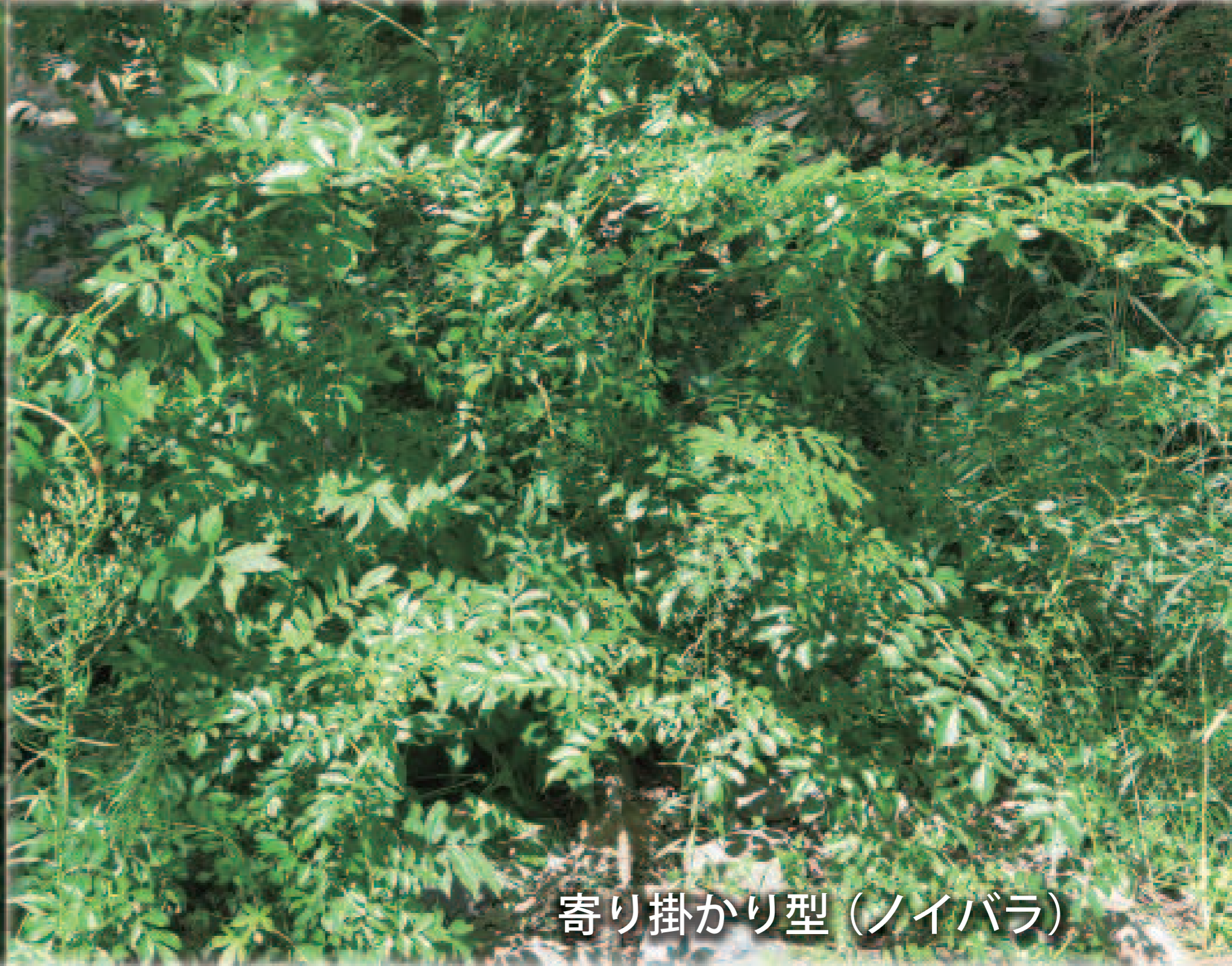
寄り掛かり型 (ノイバラ)