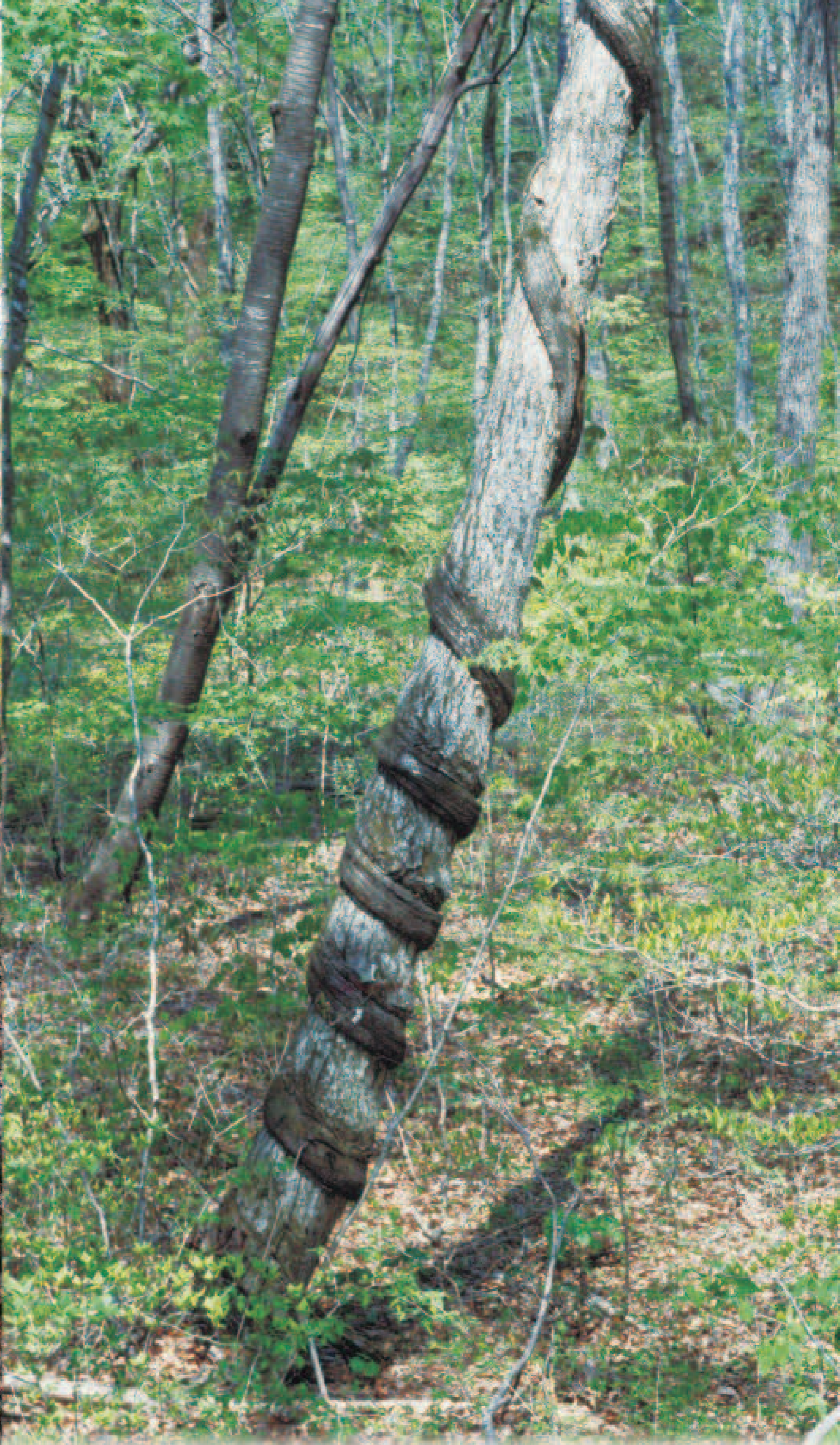
コナラの幹に巻き付き食い込むフジ