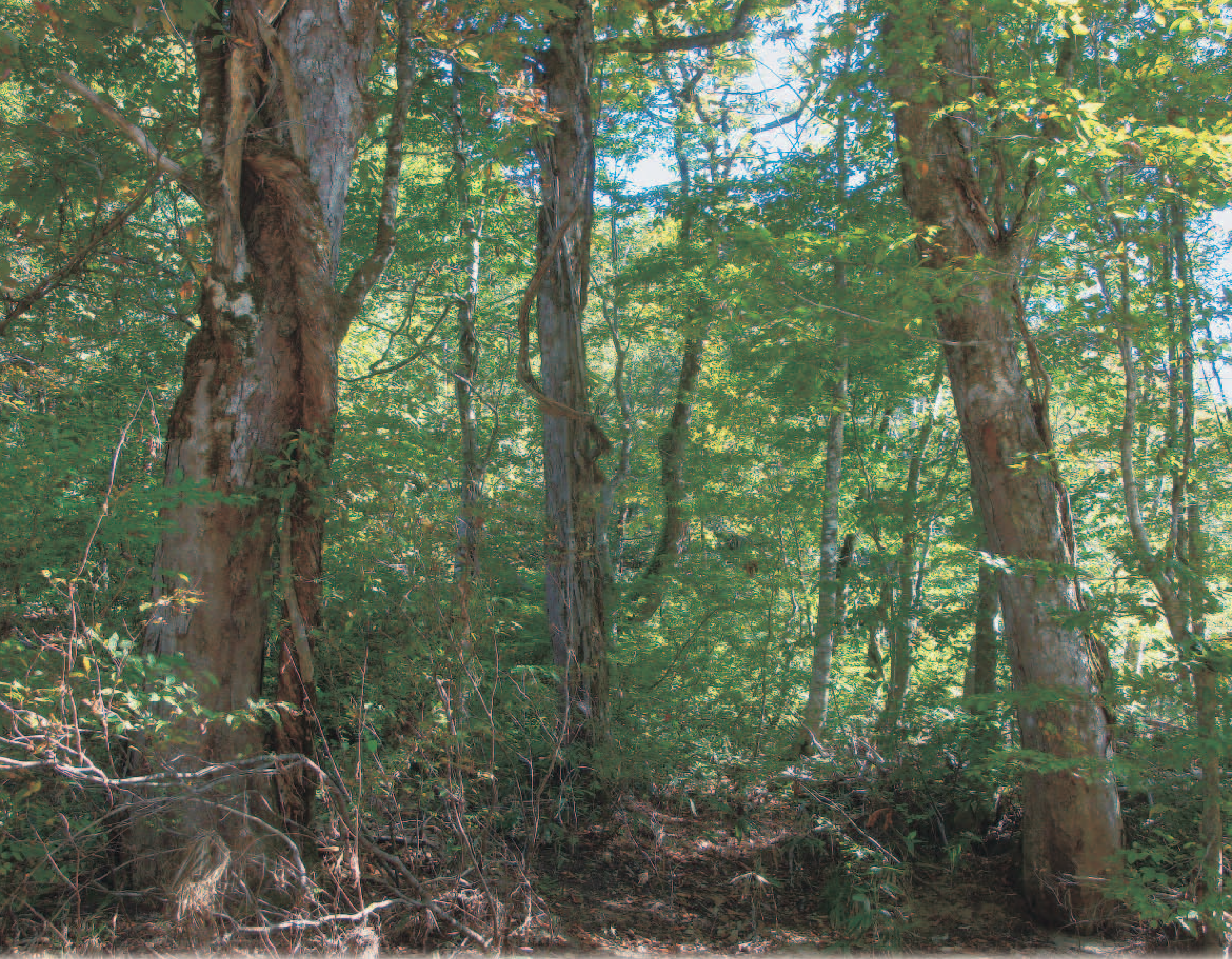
天然林内の樹木に取り付く様々な木本性つる植物（小戸沢上流）