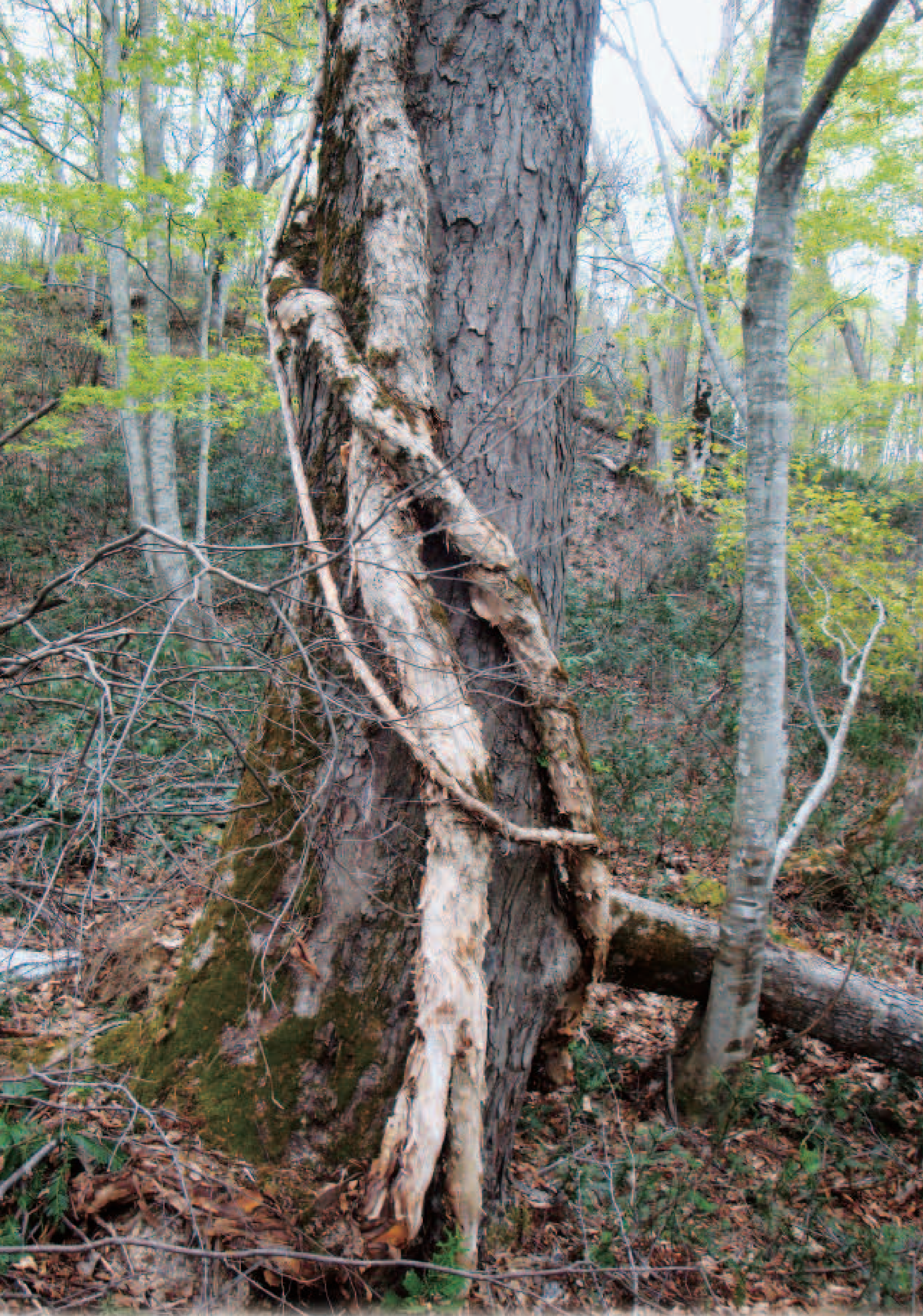
トチノキに取り付くツルアジサイ