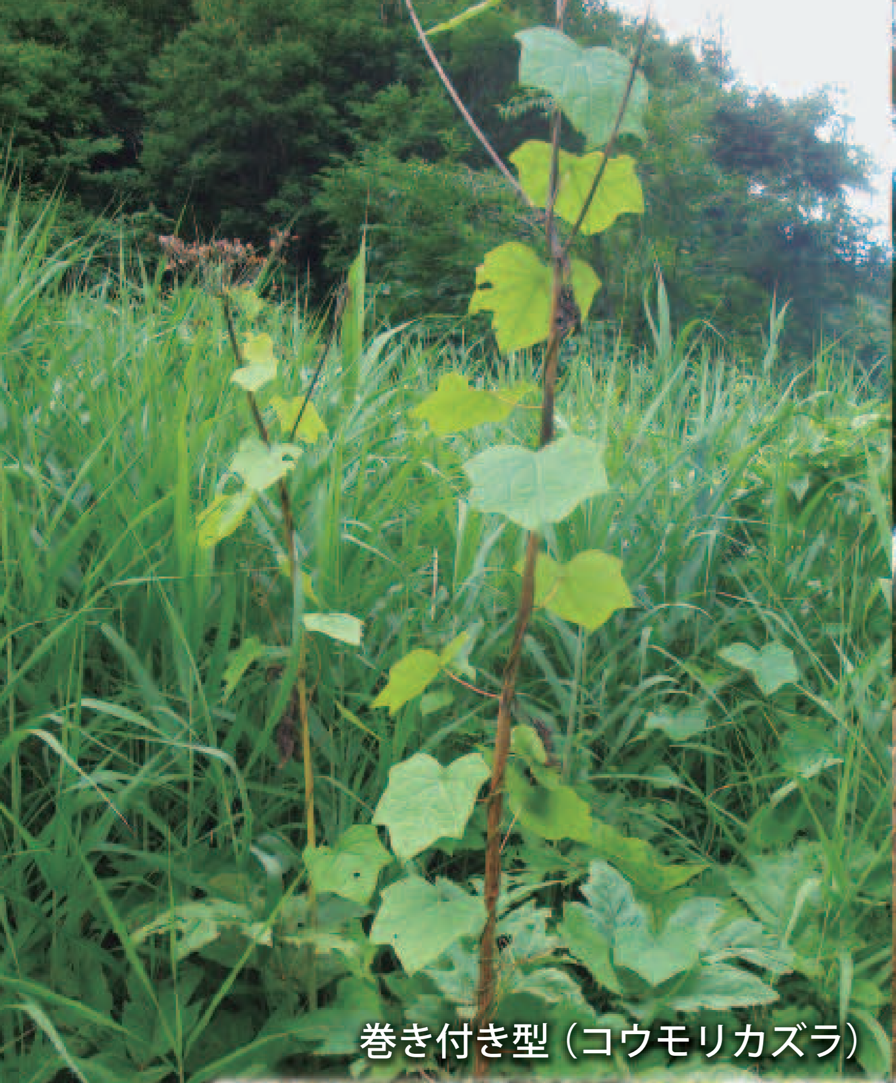
巻き付き型 (コウモリカズラ)